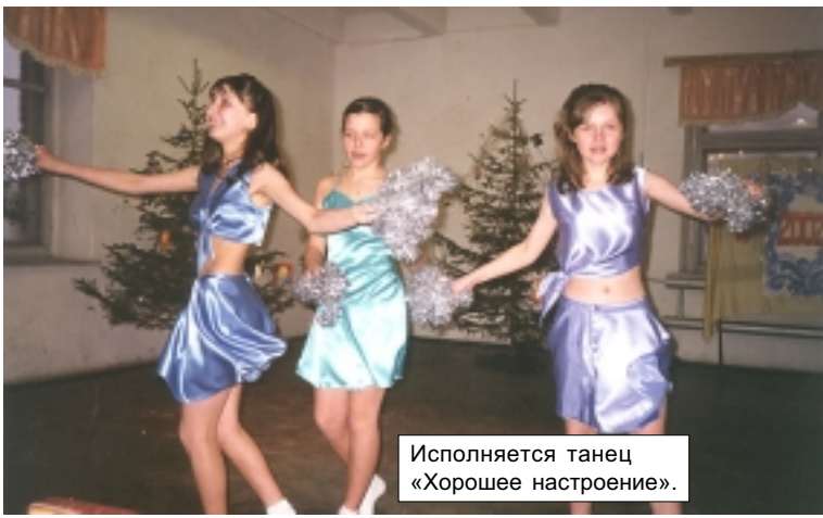
Исполняется танец «Хорошее настроение».

И. ЦВЕТКОВ, начальник экскаваторного участка