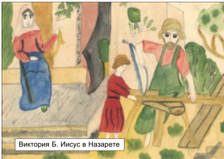
Виктория Б. Иисус в Назарете