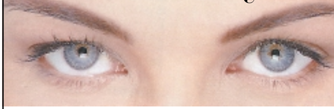
Ведущая Наталья СЕРЕБРЯКОВА