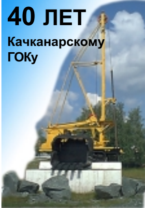
40 ЛЕТ Качканарскому ГОКУ