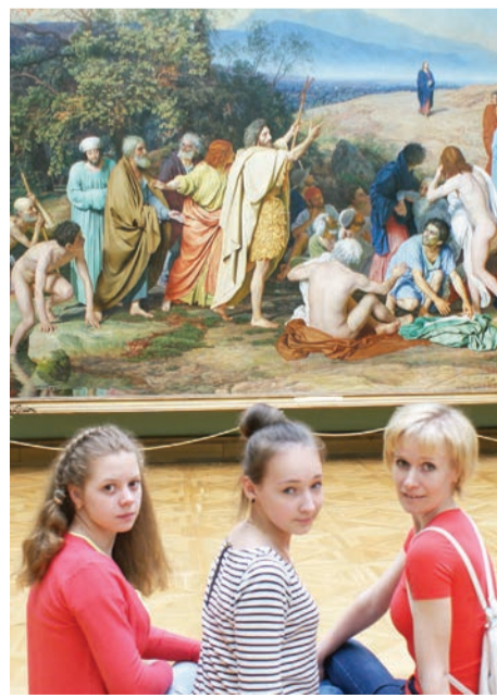
В Третьяковской галерее. Прикоснулись к вечности