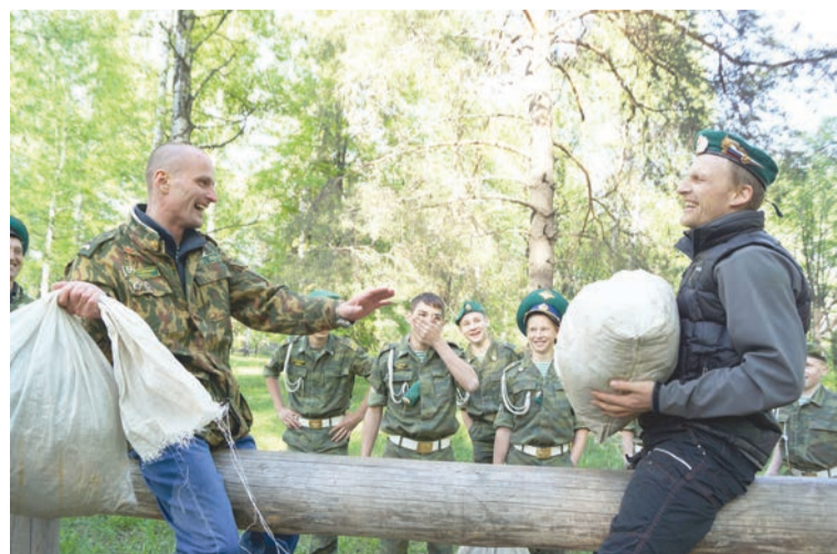
Борьба с мешками на бревне. Кто победит?

Пока происшествий на перекрестке не было.