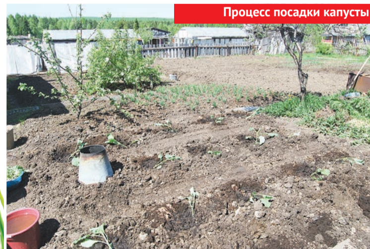
Процесс посадки капусты

Потом надо было капусту обильно полить, у меня ушло по полведра воды на каждый кустик, и притенить. Ради тени над капустой сходили в лесочек, срубили немного еловых лап, воткнули их вокруг саженцев. Будем теперь ждать – понравится у нас капусте или нет.