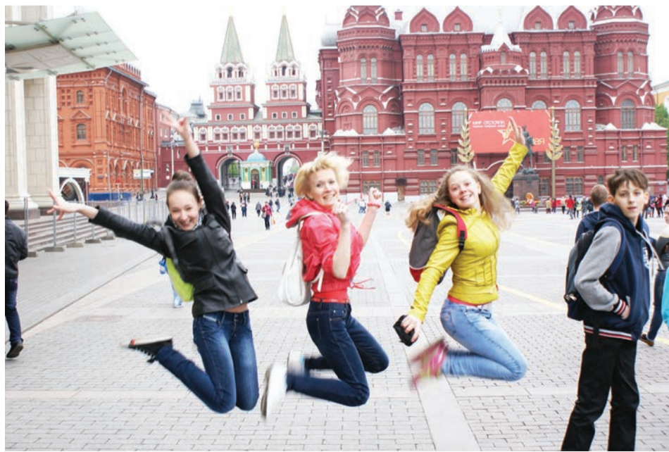
Красная площадь оказалась не такой большой, как по телевизору. Но всё равно было здорово!