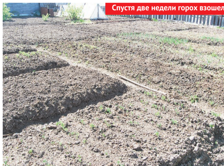
Спустя две недели горох взошел

Также точно посадила морковь, с той лишь разницей, что семена были на ленточке. Ленточку растянула по бороздке, потом прикопала земелькой, полила и до, и после)))