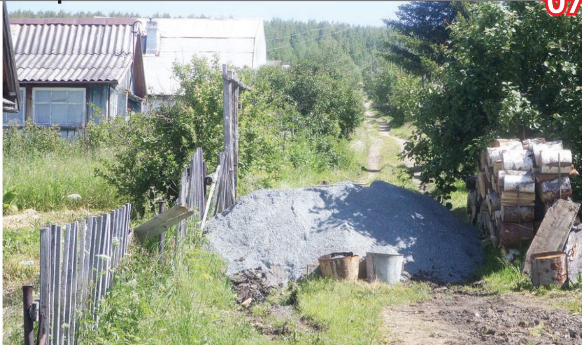
Подобным образом перегорожено большинство улиц, ведущих к седьмому саду