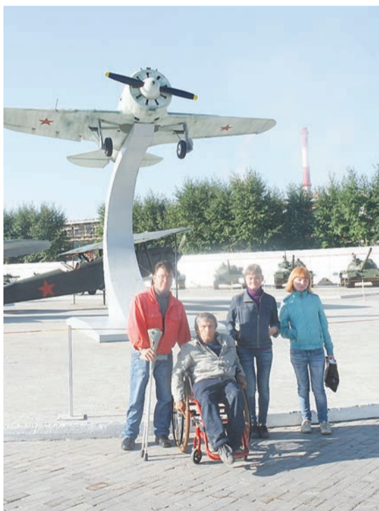
К сожалению, очень редко мы можем делать такие фото на память!

26 августа ребята из Качканарского общества инвалидов, по приглашению Верхне-Пышминской организации ВОИ, посетили музей военной техники «Боевая Слава Урала». В этот же день в музей приехали члены обществ инвалидов из Лесного, Каменска-Уральского, Полевского, Режа, Екатеринбург, поселка Арти и многих других.