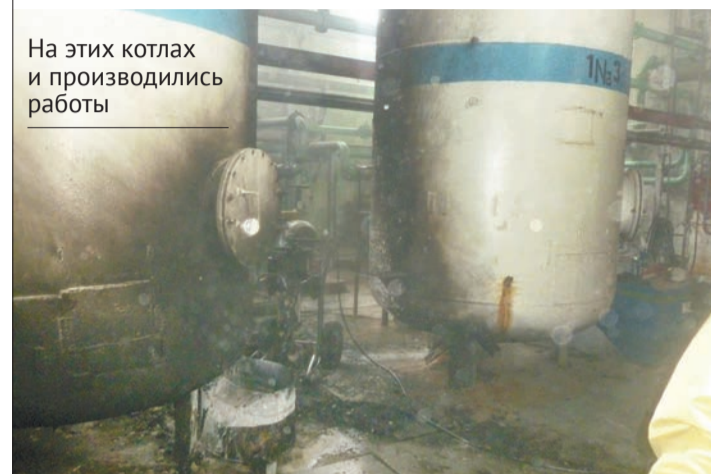
На этих котлах и производились работы