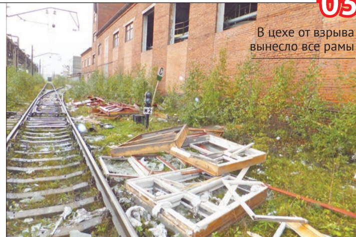
В цехе от взрыва вынесло все рамы

Мужчины сидят без работы. Думали, что будет легче, но на работу пока не берут. Вот мы кинулись, приехали, а власти не поймут, что с нами делать.